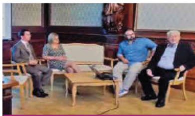
A fogyasztóvédelmi referensek nélkülözhetetlenek, értettek egyet a kerekasztal-beszélgetés résztvevői

esetben problémát, de a tisztességtelen piaci magatartás a minőséget szem előtt tartó cégeknek is veszteséget jelent.